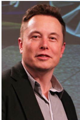
Voorgestelde meeting met: Elon Musk, CEO

Born in South Africa in 1971, Elon Musk became a multimillionaire in his late 20s when he sold his start-up company, Zip2, to a division of Compaq Computers. He achieved more success by founding X.com in 1999, SpaceX in 2002 and Tesla Motors in 2003. Musk made headlines in May 2012 when SpaceX launched a rocket that would send the first commercial vehicle to the International Space Station.