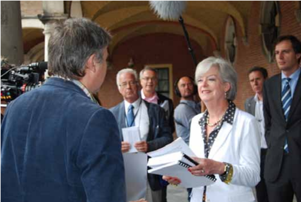
Inontvangstname AOW-petitie door senator Kneppers-Heijner, namens de vaste commissie voor Sociale Zaken en Werkgelegenheid