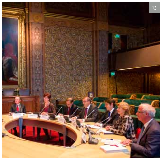
De Parlementaire Onderzoekscommissie bij de openbare gesprekken