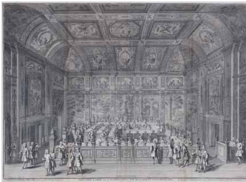
‘Vergader-Kamer van de Heeren Staten van Holland en Westvriesland’ Gravure uit 1730

Tijdens de plenaire behandeling van het wetsvoorstel op 5 juni 2012 bleek dat de Kamer een aantal bezwaren had tegen het geheel laten vervallen van het nationaliteitsvereiste. Allereerst is de Kamer principieel tegen het fenomeen van de ‘nationale kop’ bij implementatiewetgeving. Het Europees Hof oordeelde dat het nationaliteitsvereiste volgens het Europese recht niet mag gelden voor burgers uit EU-landen, maar wel voor burgers uit andere dan EU-landen. Het openstellen van het ambt voor burgers wereldwijd – de nationale kop – acht de Kamer bezwaarlijk. Ook voelde de Kamer weinig voor het openstellen van het ambt van notaris voor alle denkbare nationaliteiten wanneer er geen sprake is van wederkerigheid. De regering zegde vervolgens een wetswijziging toe met de strekking dat het nationaliteitsvereiste wordt vervangen door de eis van Unieburgerschap (inclusief het burgerschap van de EER-landen), en dat het wetsvoorstel pas in werking treedt als de bedoelde wetswijziging door de Kamers is aanvaard.