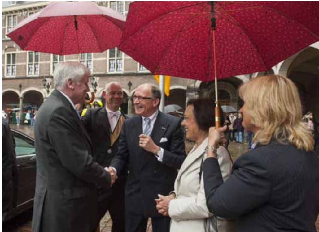
Ontvangst Voorzitter Duitse Bondsraad 6 juni 2012

In dit kader ontving de Eerste Kamer ook dit vergaderjaar weer verschillende buitenlandse delegaties. Veel van deze ontmoetingen zijn gezamenlijk met de Tweede Kamer georganiseerd. Naast ontmoetingen met een aantal buitenlandse Senaatsvoorzitters en ontmoetingen met een multilateraal karakter, ontving de Eerste Kamer ook vertegenwoordigers van de uitvoerende macht. Daarnaast bestond er in het afgelopen parlementaire jaar bijzondere aandacht voor ontwikkelingen in interparlementaire Assembles en interparlementaire conferenties in EU-verband. Hierna volgt een selectie van een aantal in het oog springende internationale ontmoetingen.