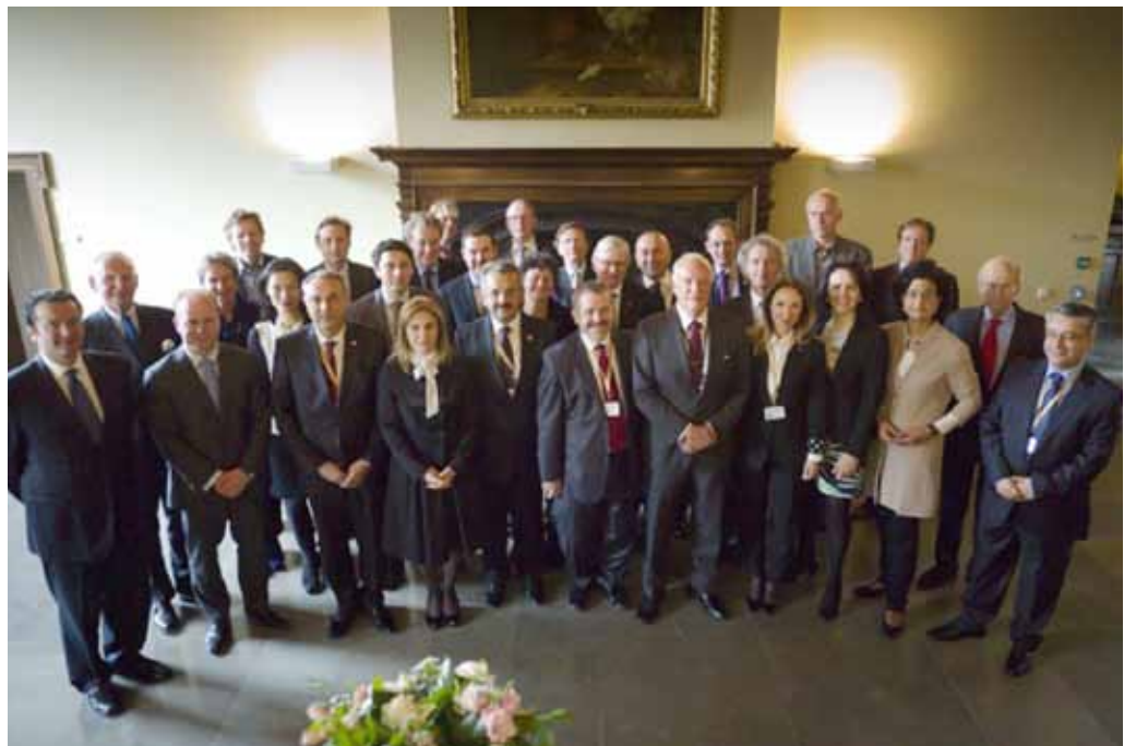
Groepsportret Turkse delegatie, Eerste Kamerleden en Tweede Kamerleden 17 april 2012

In 2012 vieren Nederland en Turkije 400 jaar diplomatieke betrekkingen. Een staatsbezoek van de Turkse president, de heer Abdullah Gül, aan Nederland was de culminatie van verschillende culturele evenementen en activiteiten die in dit kader in Turkije en Nederland plaatsvonden. De heer Gül werd op 18 april 2012 ontvangen in de Eerste Kamer door de Voorzitters van de beide Kamers der Staten-Generaal. Tijdens het bezoek ging de president in gesprek met verschillende Kamerleden, onder andere over de betrekkingen tussen Turkije en Europa, de situatie in Syrië en de eventuele rol van de Verenigde Naties en de NAVO in dat conflict. In voorbereiding op dit staatsbezoek ontvingen leden van de commissies voor Buitenlandse Zaken, Defensie en Ontwikkelingssamenwerking en voor Europese Samenwerkingsorganisaties op 17 april 2012 een delegatie van Turkse parlementsleden voor een werklunch. De gesprekspartners bediscussieerden daarbij recente ontwikkelingen in Turkije, Nederland en Europa.